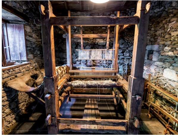
Telar visible en el Pazo da Pena Manzaneda

El telar manual se remonta a la era antigua. En los siglos XVII y XVIII apenas había en Galicia aldeas sin telares, pues la gente tejía en sus casas el lienzo que luego vendían en los mercados, motivo por el cual la producción de lienzo era muy elevada. Aunque con el paso del tiempo el cultivo del lino fue desapareciendo, aunque hoy quedan telares en varias aldeas de Galicia.